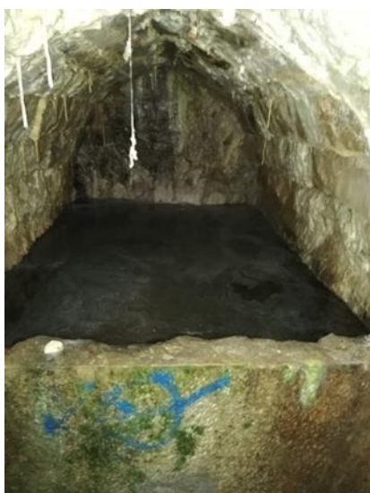
résurgence bouchée de la source.