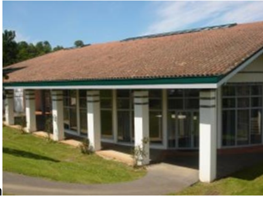
salle des fêtes Inessa de Gaxen