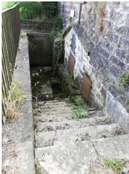
escalier extérieur de la

source : grille habituellement fermée, sous-sol de la chapelle, source bouchée à droite.