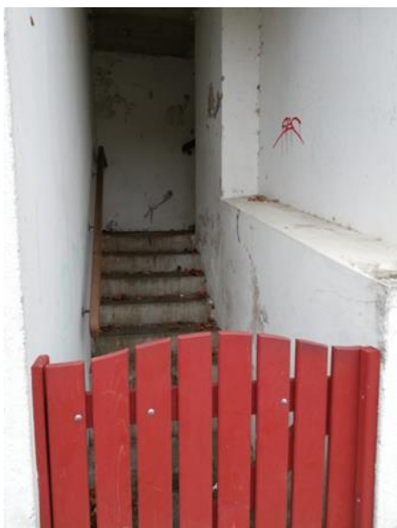
escaliers donnant sur le fronton, côté rue St Jean