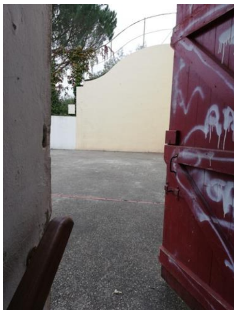
sortie des escaliers, vers le fronton