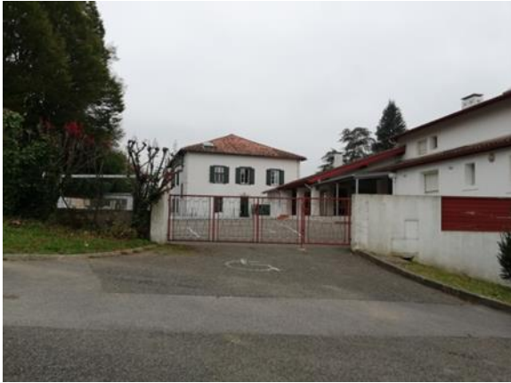
école publique, début du chemin de l'Hospice, à sa gauche.