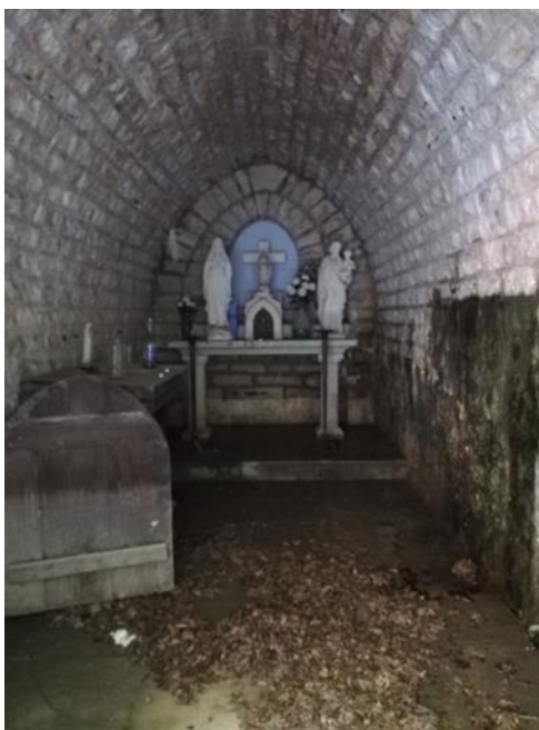
intérieur du sous-sol

: à gauche, porte ouverte donnant sur l'extérieur de la source, lieu de vie de Simon.