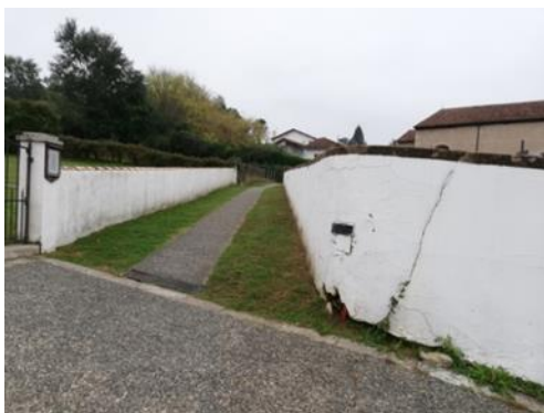
passage derrière l'église (allée des cimetières)