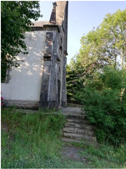
chapelle Notre Dame de Clairence