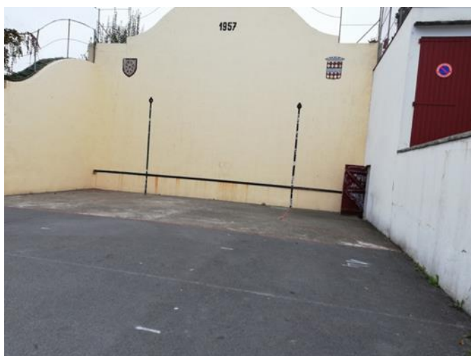
fronton, porte à droite donnant sur les escaliers.