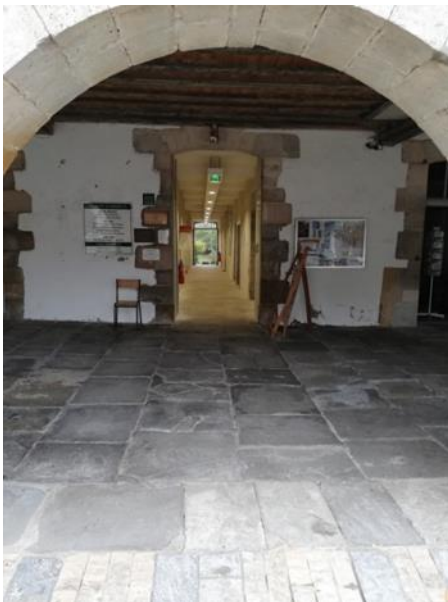
passage maison Darrieux