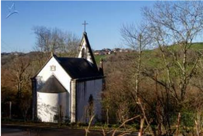
chapelle Notre Dame de Clairence